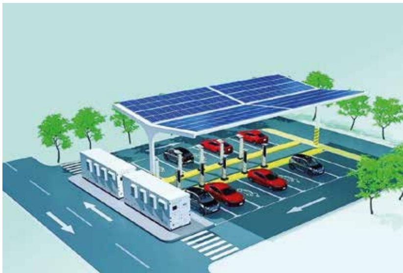
Фиг.4. Хибридна зарядна станция 360kW/1000Vdc/ BESS 600kWh/ PV 200kWp MPPT, снабдена с 10 зарядни колонки по 180kW/250A тип CCS2.

Системата е изградена като микромрежа (Microgrid) с модулна структура и включва: