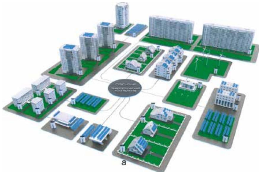
Фиг.3. Енергийна общност