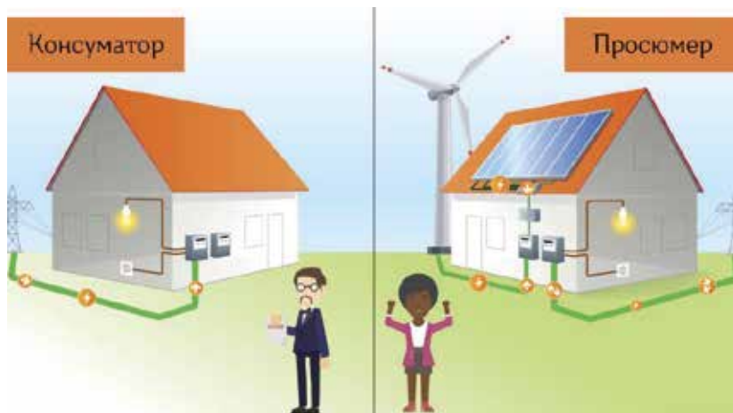
Фиг.2. Разлика между консуматори и просюмери

Енергийна сигурност: Просюмерството увеличава енергийната сигурност, като намалява рисковете от прекъсвания в доставките и създава по-устойчива енергийна инфраструктура.